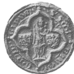
Das Gindericher Schöffensiegel aus dem 15. Jahrhundert mit einer Darstellung des Gnadenbildes.