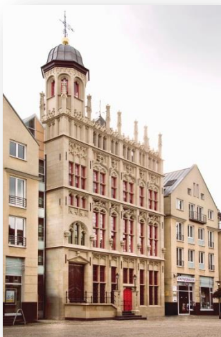
Historisches Rathaus Wesel

Die Kreisstadt Wesel (Hansestadt) mit rund 62.000 Einwohnern liegt inmitten der idyllischen niederrheinischen Kulturlandschaft. Geprägt durch die vielseitigen Erholungs- und Freizeitmöglichkeiten, der Lage an Rhein und Lippe, einem reichhaltigen Kulturangebot sowie Einkaufsmöglichkeiten ist Wesel attraktiver Ausflugs- und Anziehungspunkt in der Region. Wahrzeichen der Stadt sind u.a. das Berliner Tor, die im Jahre 2009 fertiggestellte Niederrhein-Brücke sowie die Zitadelle mit Preußen-Museum, Musik- und Kunstschule und Stadtarchiv. Getreu dem Ehrennamen „Vesalia Hospitalis“ (gastliches Wesel) fühlen sich die Weseler bis heute verpflichtet, gute Gastgeber zu sein.